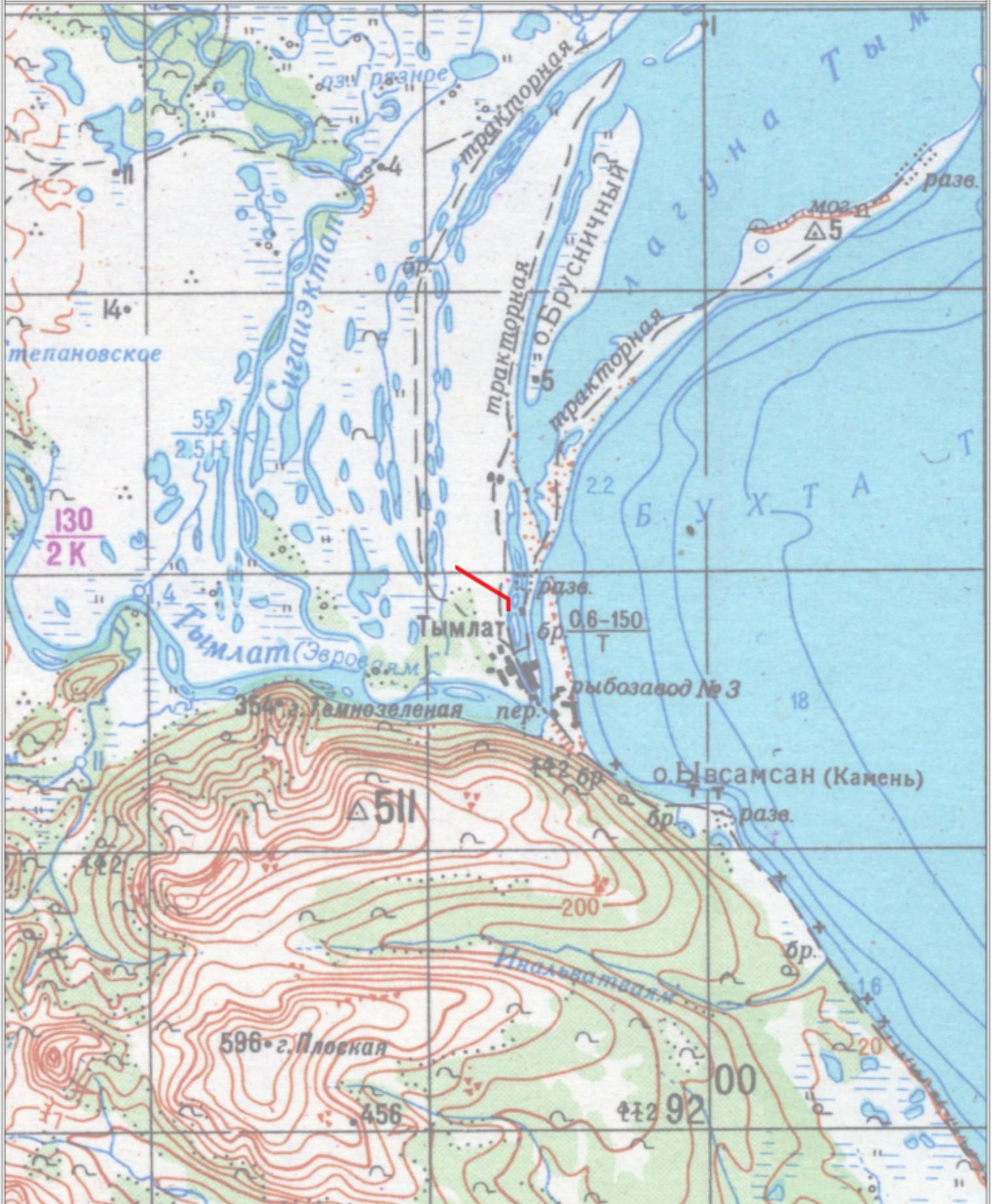
Схема расположения здания (части здания) на земельном участке